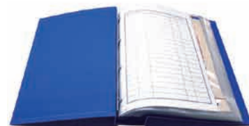
背割れ式バインダーですので、用紙の抜き差ししがとてもスムーズです

※背見出しラベルは、下記よりお選び下さい。(法務局によっては保存年数の異なることがあります。)※