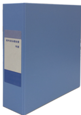
みすゞ給報ファイル F5S (A5タテ)