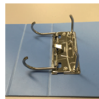
Dリング：金具が大きく開き綴り易い