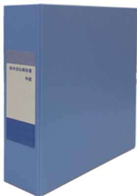
みすゞ給報ファイル F5S (A5タテ)