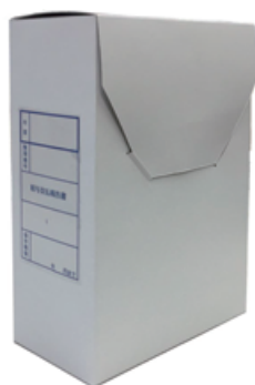
みすゞ給報保存箱 HB-5K (A5)